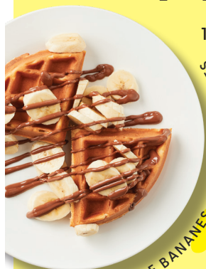
DEMI-GAUFRE BANANES CHOCO-NOISETTES

10 ans et moins. Jus, lait ou lait au chocolat inclus.