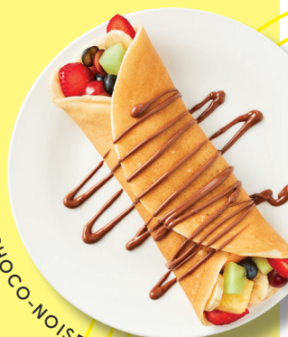
CRÊPE CHOCO-NOISETTES ET FRUITS