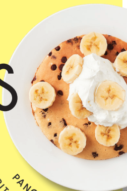
PANCAKE AUX PÉPITES DE CHOCOLAT

Crêpe tartinade choco-noisettes avec choix de Bananes ou fruits frais 9.45 ou Bleuets ou fraises 10.65